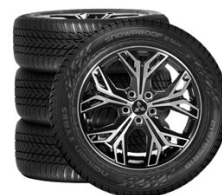
18" Zliatinové Nokian Snowproof 2 SUV 215/55 R18