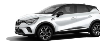
Prémiová metalická biela Crystal White / čierna strecha 1 000 EUR