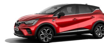
Prémiová metalická červená Sunrise Red / čierna strecha 1 000 EUR