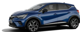
Metalická modrá Royal Blue 600 EUR