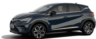
Štandardná modrá Charcoal Blue