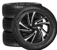
17" Zliatinové Nokian Snowproof 2 SUV 215/60 R17