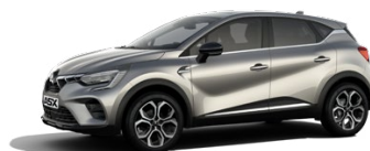
Metalická sivá Steel Grey 600 EUR