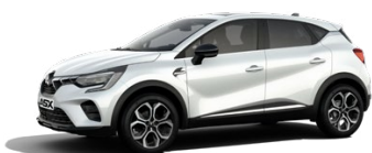
Prémiová metalická biela Crystal White 750 EUR