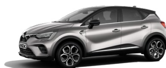
Metalická sivá Steel Grey / čierna strecha 750 EUR