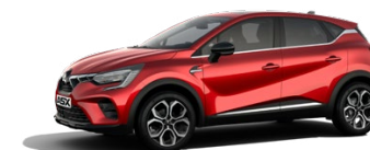
Prémiová metalická červená Sunrise Red 750 EUR