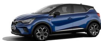
Metalická modrá Royal Blue / čierna strecha 750 EUR