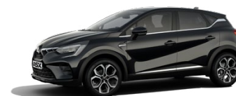
Metalická čierna Onyx Black 600 EUR