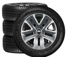
17" Oceľové Nokian Snowproof 2 SUV 215/60 R17 1 219 EUR Cena nezahŕňa plastové kryty kolies